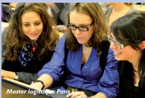
Master logistique Paris