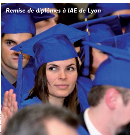
Remise de diplômes à IAE de Lyon