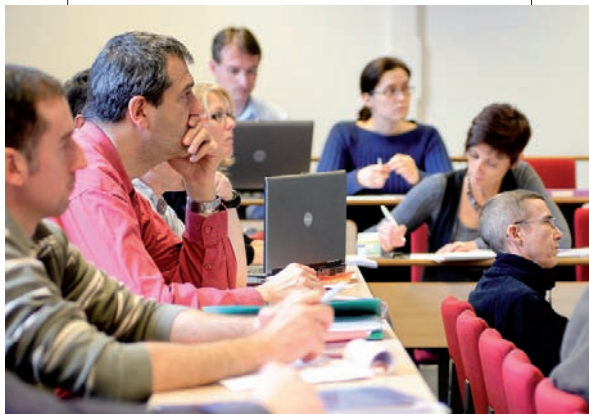
Formation continue à IAE de Lyon

Une expérience à l'étranger constitue aussi un atout indéniable et une bonne porte d'entrée pour accéder par la suite à des responsabilités dans la Supply Chain. Depuis 2000, la voie royale pour ce type de missions à l'international s'appelle le V.I.E (Volontariat International en Entreprise), pour