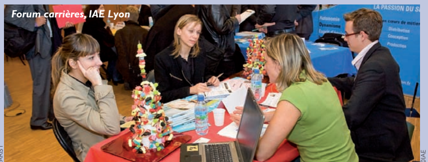
Forum carrières, IAE Lyon