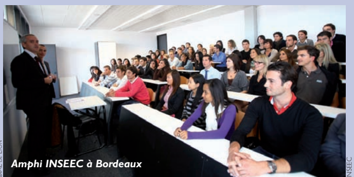
Amphi INSEC à Bordeaux