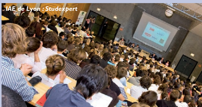
IAE de Lyon : Studexpert

Gare au risque de cloisonnement dans un secteur ou sur une fonction particulière, en contradiction avec la transversalité du métier de Supply Chain Manager auquel certains diplômés pourront légitimement aspirer après une dizaine d'années d'expérience. A condition de toucher aux différents maillons clé de la chaîne. C'est pourquoi certaines écoles conseillent volontiers à leurs étudiants de s'as-